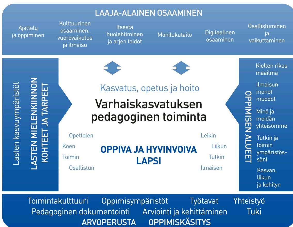
Kuvio 1. Varhaiskasvatuksen pedagogisen toiminnan viitekehys

Varhaiskasvatuksen pedagogista toimintaa ja sen toteuttamista kuvaa kokonaisvaltaisuus. Tavoitteena on edistää lasten oppimista ja hyvinvointia sekä laaja-alaista osaamista (kuvio 1). Pedagoginen toiminta toteutuu lasten ja henkilöstön välisessä vuorovaikutuksessa ja yhteisessä toiminnassa. Lasten omaehtoinen, henkilöstön ja lasten yhdessä ideoima sekä henkilöstön suunnittelema toiminta täydentävät toisiaan. Varhaiskasvatuksen pedagoginen toiminta läpäisee kasvatuksen, opetuksen ja hoidon kokonaisuuden.