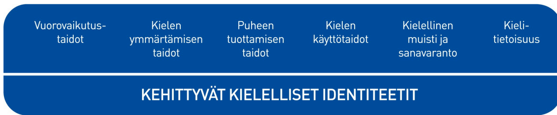
Kuvio 2. Lasten kielen kehityksen keskeiset osa-alueet varhaiskasvatuksessa

Vuorovaikutustaitojen kehittymisen kannalta lasten kokemukset kuulluksi tulemisesta ja siitä, että heidän aloitteisiinsa vastataan, ovat tärkeitä. Henkilöstön sensitiivisyys ja reagointi myös lasten non-verbaaleihin viesteihin on keskeistä. Vuorovaikutustaitojen kehittymistä tuetaan kannustamalla lapsia kommunikoidaan toisten lasten ja henkilöstön kanssa.