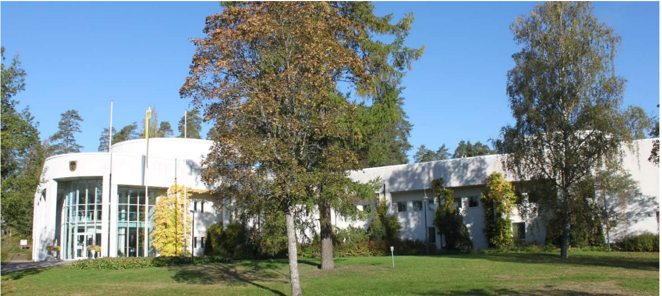
Parempi paikka etätöille

Luumäen kunnalta vuokraat helposti itsellesi etätyöpisteen päiväksi, tai vaikka viikoksi kerrallaan. Saat käyttöösi langattoman nettiyhteyden, viihtyisän lukittavan työpisteen omalla sisäänkäynnillä ja tarpeisiisi mukautuvat kalusteet. Yhteiskäytössäsi on työpisteen välittömässä läheisyydessä invamitoitettut WC-tilat ja kymmenille hengille suunnitellut kokoushuoneet. Kunnantalon kahviautomaatti on sinun ja vieraidesi käytettävissä; ja mikäli koronarajoitukset sallivat; voit vaihtaa kahviossa kuulumisia muiden kunnantalolla työskentelevien kanssa.