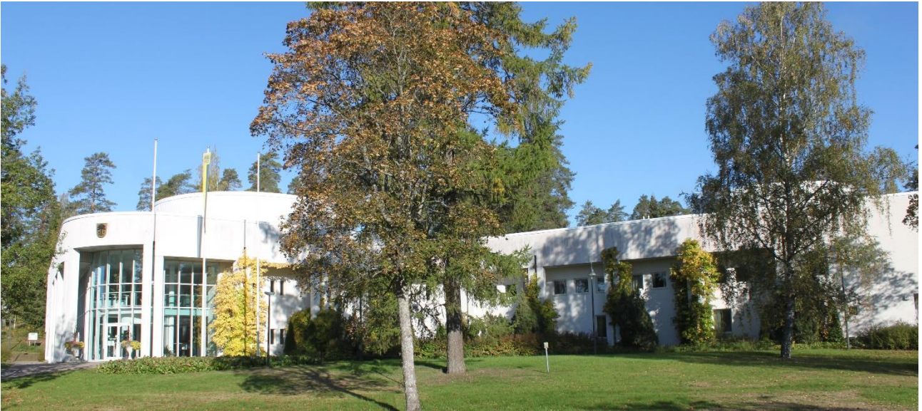
Parempi paikka etätöille

Luumäen kunnalta vuokraat helposti itsellesi etätyöpisteen päiväksi, tai vaikka viikoksi kerrallaan. Saat käyttöösi langattoman nettiyhteyden, viihtyisän lukittavan työpisteen omalla sisäänkäynnillä ja tarpeisiisi mukautuvat kalusteet. Yhteiskäytössäsi on työpisteen välittömässä läheisyydessä invamitoitettut WC-tilat ja kymmenille hengille suunnitellut kokoushuoneet. Kunnantalon kahviautomaatti on sinun ja vieraidesi käytettävissä. Voit vaihtaa kahviossa kuulumisia muiden kunnantalolla työskentelevien kanssa.